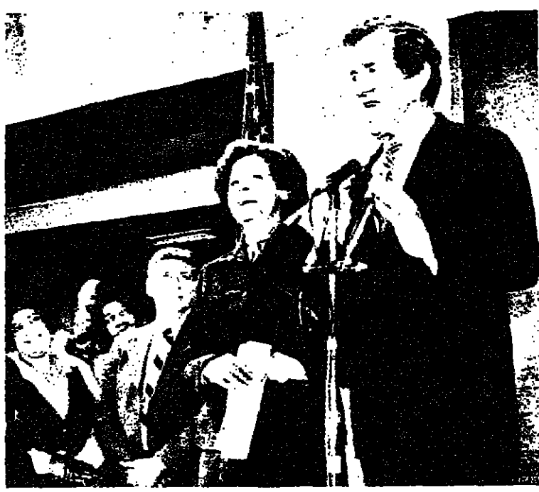
وزير الخارجية الامريكى امونوماسكي في حفل اقامه موظفو وزارته لتهنئته بمناسبة مباشرته مهام منصبه.

واشنطن - صرح البروفيسور زيفنيسيف بجيجنسكي مستشار الرئيس الامريكى بشؤون الامن القومي بان التدخل السوفياتي في افغانستان من شأنه ان يؤدي الى تغير ميزان القوى الدولي غير انه من المستبعد ان يؤدي ذلك الى حرب بين الدولتين العظميين. وقال البروفيسور بجيجنسكي ان على الشعب الامريكى الا يخشى احتمال نشوب الحرب، اذ ان المشكلة التي تواجهها الولايات المتحدة الان ليست وقوع مجابهة مع الاتحاد السوفياتي بل احتمال توسع النفوذ السوفياتي في المناطق الحساسة من العالم وتطرق الى العملية الامريكى الفاشلة للانجاس عن الرهائن الامريكين في ايران فقال ان البنية على ص 8 ع 8